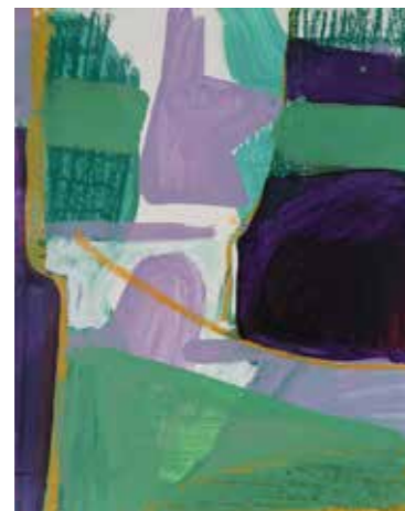
Ohne Titel, 2021

je 24 x 30 cm Acryl und Ölkreide auf Papier