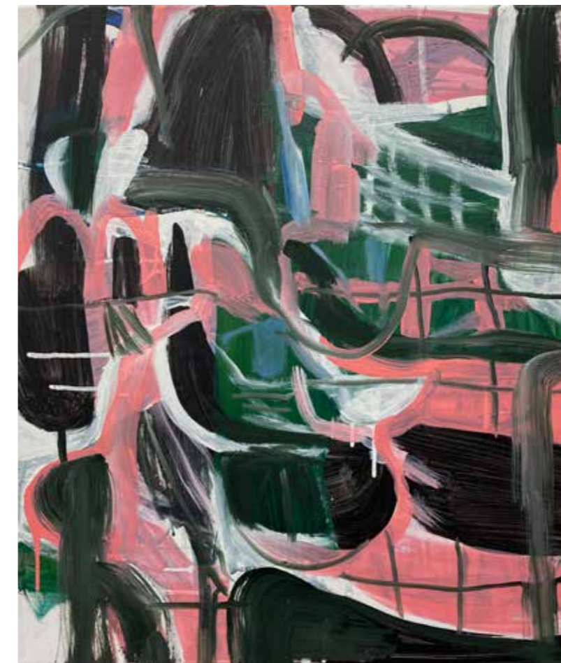
Ohne Titel, 2021

Liverpoolstrasse 15 • 45470 Mülheim Tel: +49 (0)208 377489 04 info@galerie-fox.de • www.galerie-fox.de